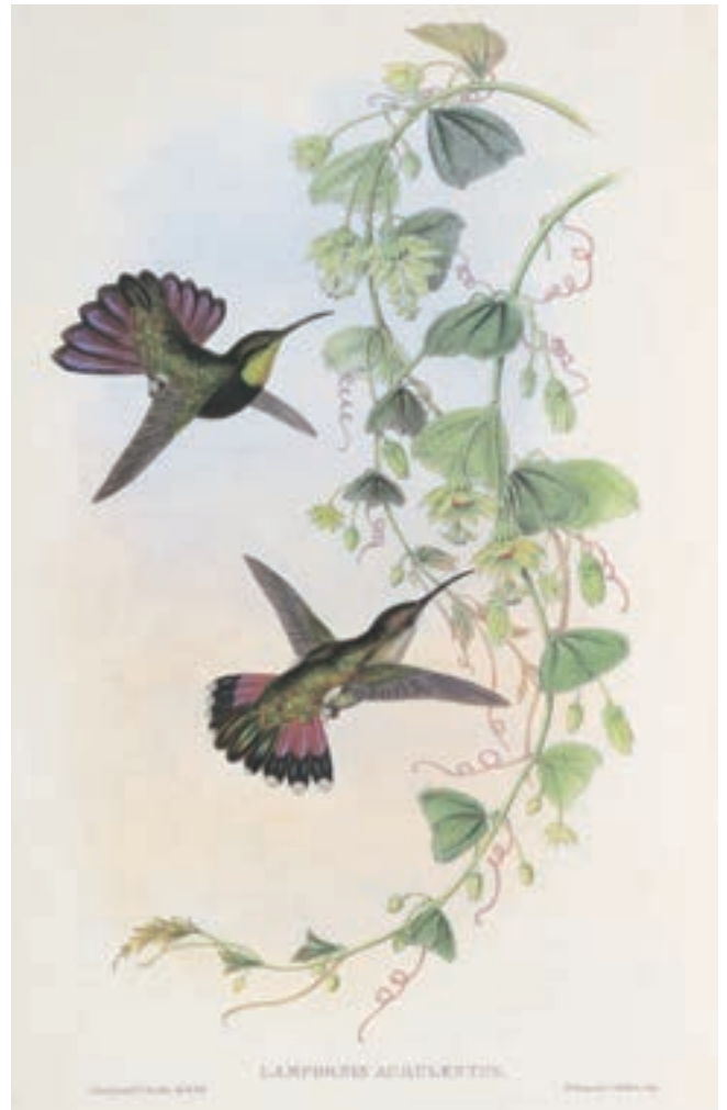
図2. ウスミドリマンゴーハチドリ Anthracothorax dominicus (= Lampornis aurulentus ). Humming Birds, vol. 2, pl. 38 (1849-1861) より. 石版画製作は John Gould と H. C. Richter. ハチドリを描くのに金属塗料が使われているようだ. 背景に描かれた蔓植物は、トケイソウの一種 Passiflora penduliflora .

19世紀は、華麗な図録の時代と言って良い。彩色の施された贅沢な図録には、当然多額の費用がかかり、イギリスではこれらの図録の出版に税金がかけられた。多くの動物研究書を著したウィリアム・スウェインソンは、「英国政府は、科学的に重要な書物の印刷出版に資金を提供するどころか税を課す」と不満を述べている 2) 。この