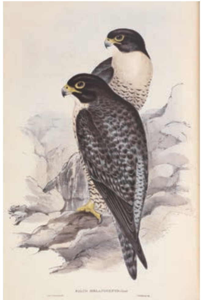
図1. ハヤブサ Falco peregrinus (= F. melanogenys ). Birds of Australia, vol. 1, pl. 8, (1840–1848)より. 石版画製作はJohn GouldとElizabeth Gould. エリザベスの手によるものであり、実物大のオスとメスが描かれている。

とはいえ、私は社会性アブラムシを専門とする昆虫学者である。身近な野鳥達には、庭で水浴び場をしつらえバードテーブルを設置するほどの愛着はあるが、鳥類が専門ではないので、グールドの近隣の文献を漁ると今更ながら再認識したこと、また初めて知ったことが多々あった。以下、グールドの図譜の独創性を特徴付ける事柄について、私自身が興味を惹かれた点について