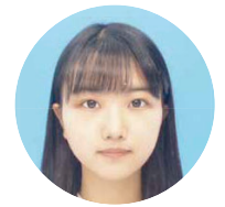
文学部人文社会科学科西洋史学専攻4年 埼玉県立坂戸高等学校出身

皆さんは、日本にどれほどの博物館、あるいは博物館相当施設が存在しているか知っていますか。「博物館」と聞くと、どこか堅苦しく、静かで、勉強のために行く場所という印象を持つ人も少なくないでしょう。しかし実際には、水族館や動物園、美術館なども博物館に含まれます。そう考えると、博物館は決して特別な存在ではなく、私たちの日常のすぐそばにある身近な文化空間だといえます。文部科学省の社会教育調査によると、日本国内だけでも5700以上の博物館が