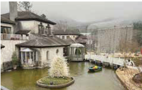
著者的 Best 1 箱根ガラスの森美術館

える。その静かな時間が、にぎやかな学生生活とは違い心地良く感じていました。あるとき、高校の授業で人生設計について考える機会があり、その中で私は、「世界中の博物館を巡りたい」という目標を書きました。そこで初めて、冒頭で紹介した博物館の館数と、人の一生では到底巡りきれないという事実を知りました。これほどまでに「時間」というものの有限性を実感したのは初めてでした。しかし同時に、その不可能性こそが、私にとって博物館をより特別な存在にしました。すべてを見ることはできない、だからこそ、ひとつひとつの出会いがかけがえないものになる。限られた時間の中で何を見るのか、どこへ行くのか、何を優先するのか。高校生の私は初めて、自分の「選択」というものを意識し、そこから今の私の博物館との距離感を形