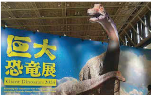
著者的 Best 2 巨大恐竜展