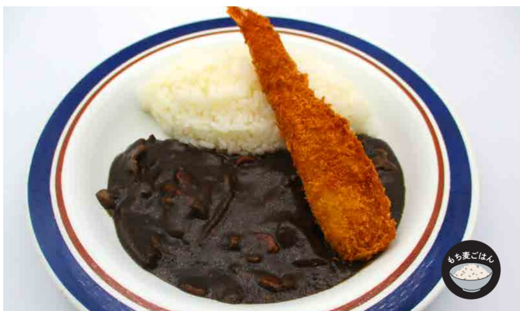
大きな海老フライのせカレー 580円