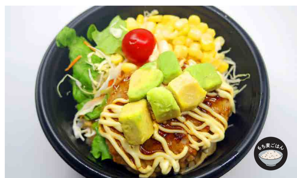
アボカドのせテリマヨハンバーグ丼 500円