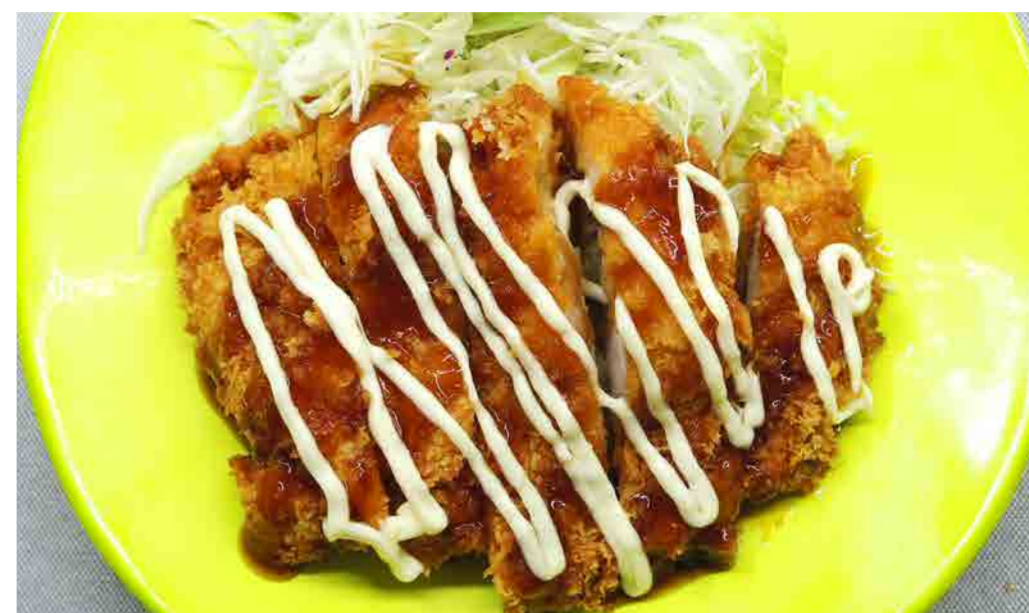
チキンカツ (タレマヨ) 450円