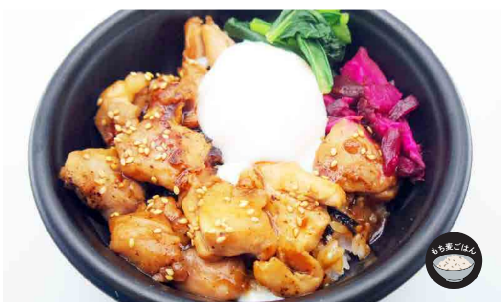
鶏の生姜焼き海苔丼 450円