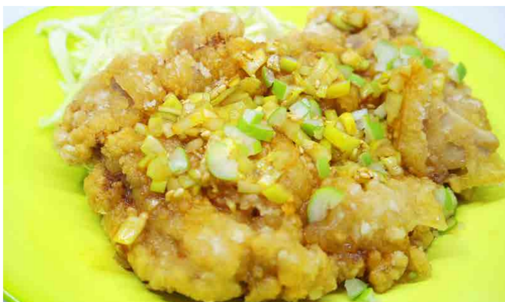
チキン唐揚 (ユーリンソース) 470円