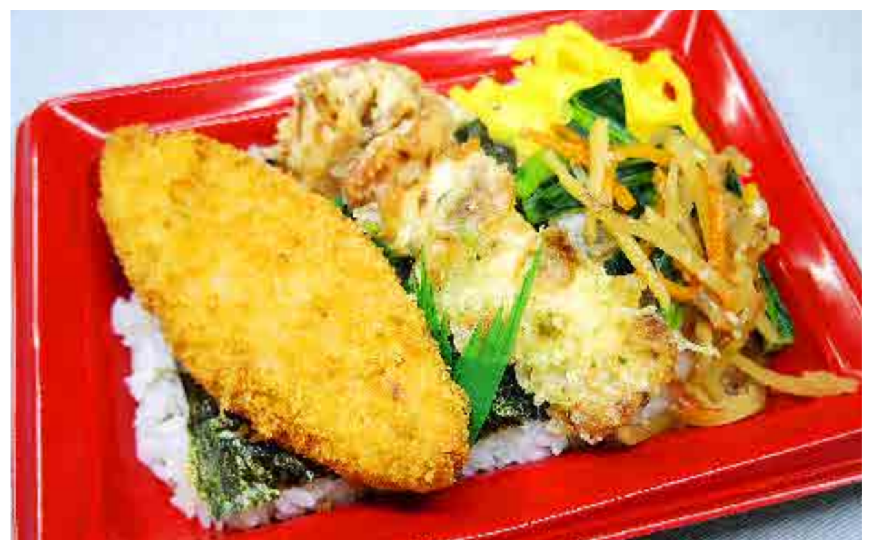
のり弁(白身魚フライ・竹輪) ¥360