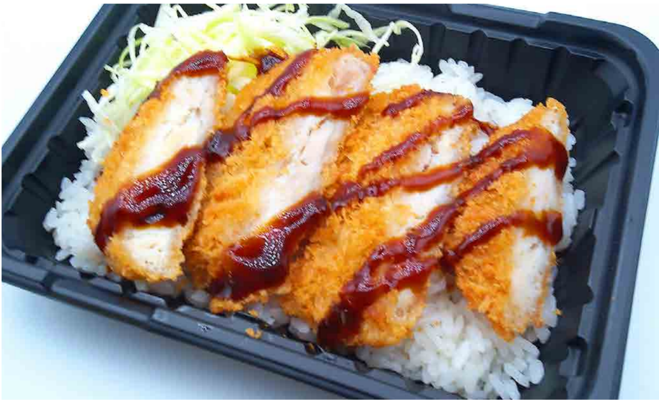
ソースチキンカツ丼(ごまソース) ¥320