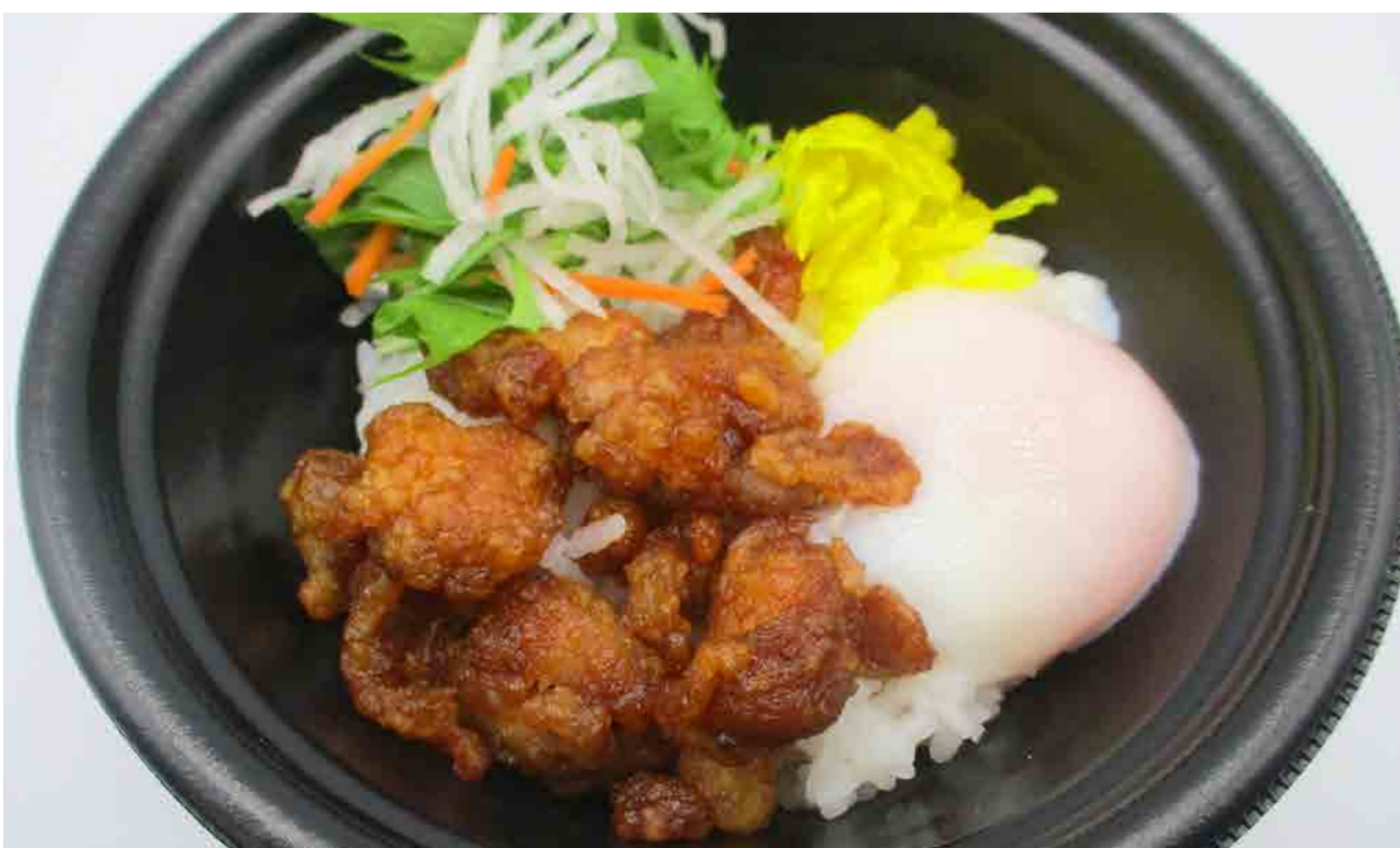
和風おろし温玉唐揚げ丼 ¥550