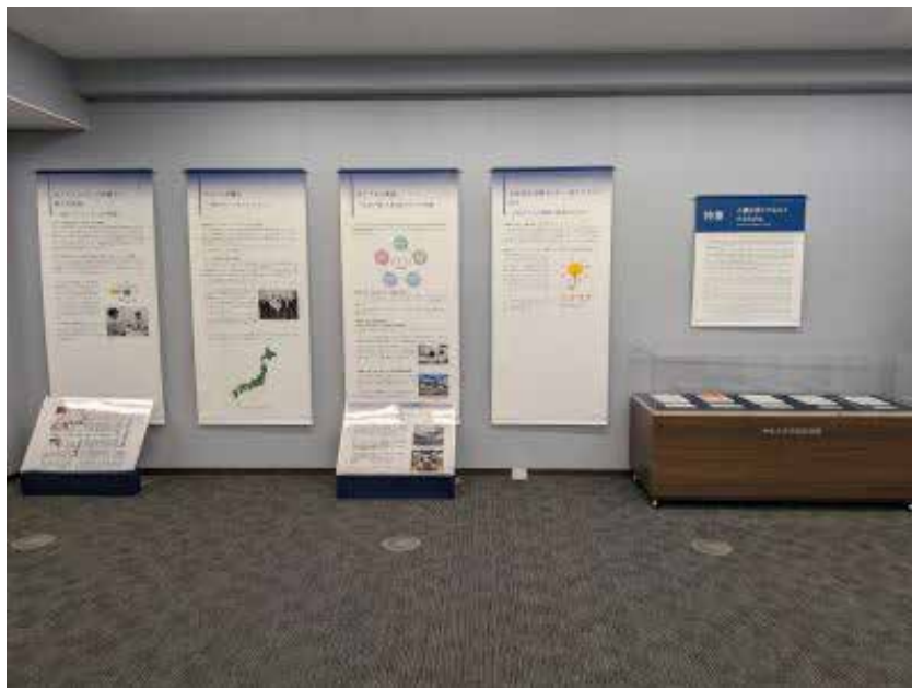
特集「人権を我々のものとするために」

そのほか法テラスの取組や役割を紹介する動画の放映、広報誌の配布、法テラス作成の白書等の閲覧スペースの提供を行っている。法テラスは2026年に設立20周年を迎えるが、設立以後20年のあゆみをまとめた冊子も閲覧することができる。