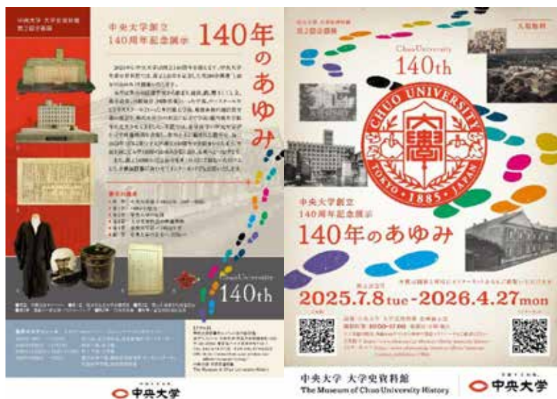
第2回企画展「140年のあゆみ」チラシ