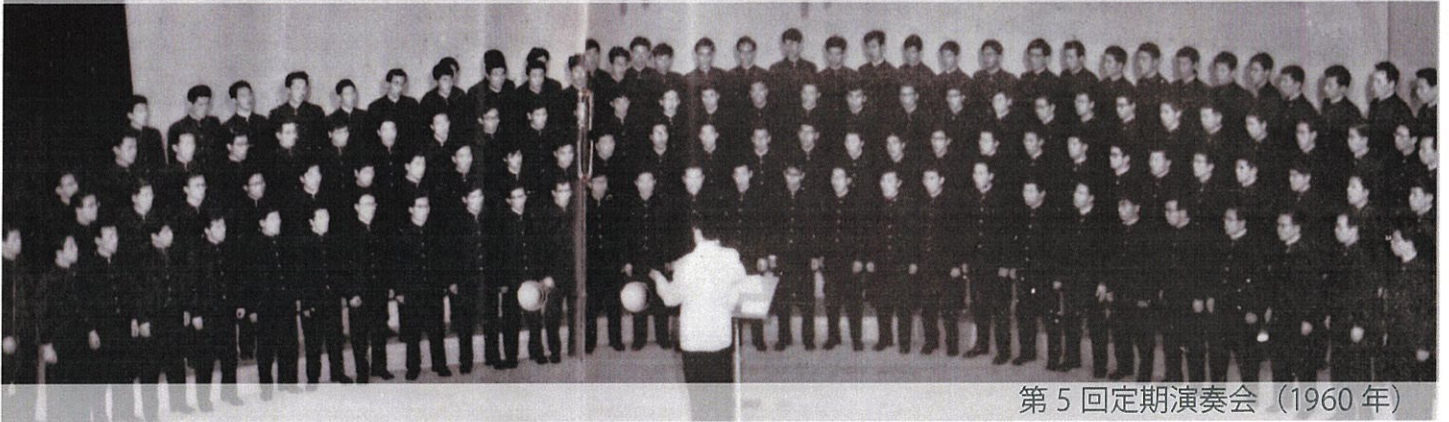
第5回定期演奏会（1960年）

中央大学音楽研究会男声合唱部（グリークラブ）は、1951年に音楽研究会の外郭団体として設立され、1952年に音楽研究会に正式所属、1959年より中央大学グリークラブに改称しました。最盛期には100名以上の部員が所属していましたが、2000年代以降に部員数が減少し、さらに新型コロナウイルス感染症によって活動が制限されたこと等で、惜しまれながら2023年に廃部となりました。2025年には、会員の高齢化のためにOB会も解散することになり、活動を通して蓄積された貴重な資料を大学史資料館へ寄贈していただくことになりました。