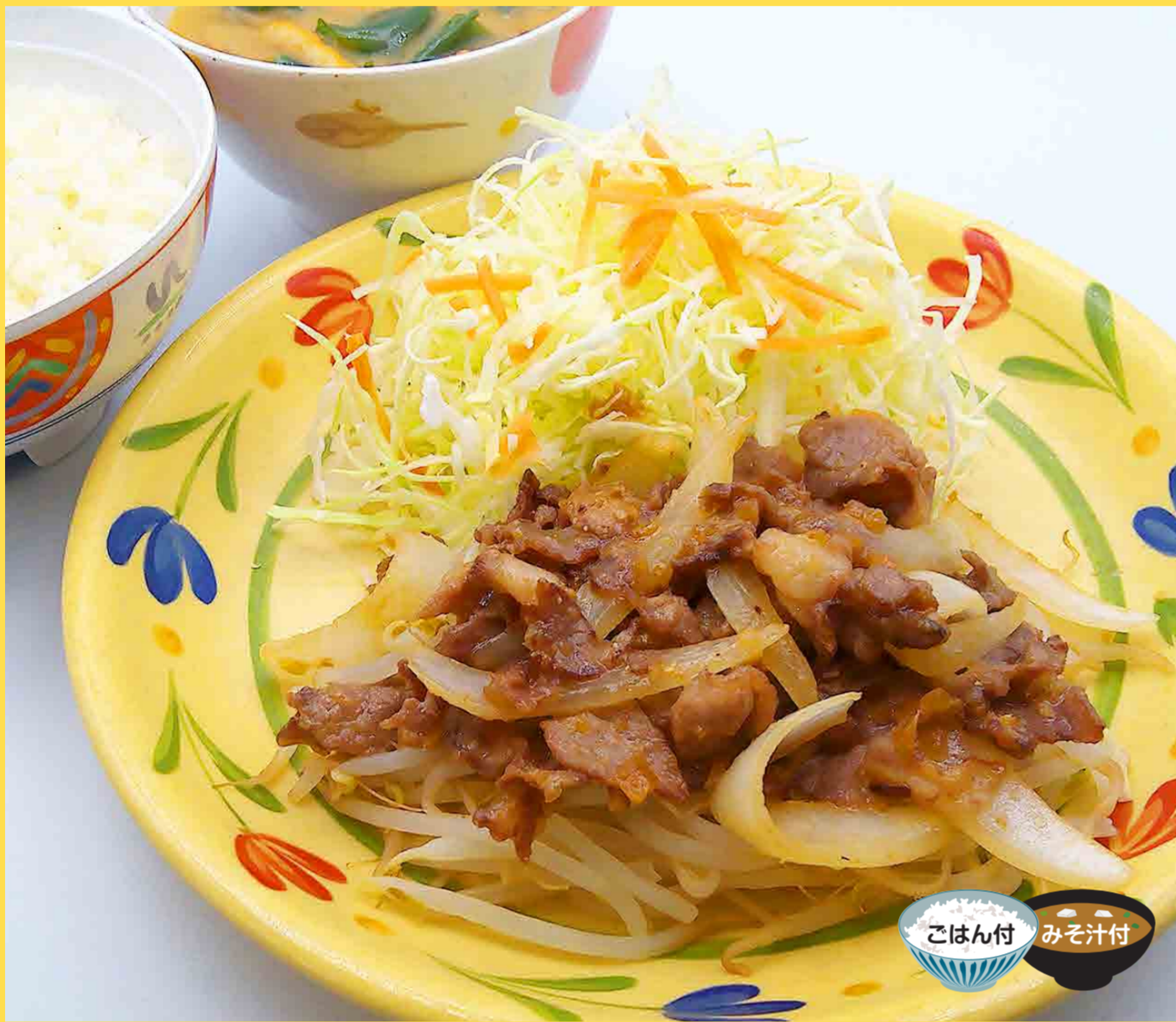
豚甘麴味噌炒め定食 ¥550