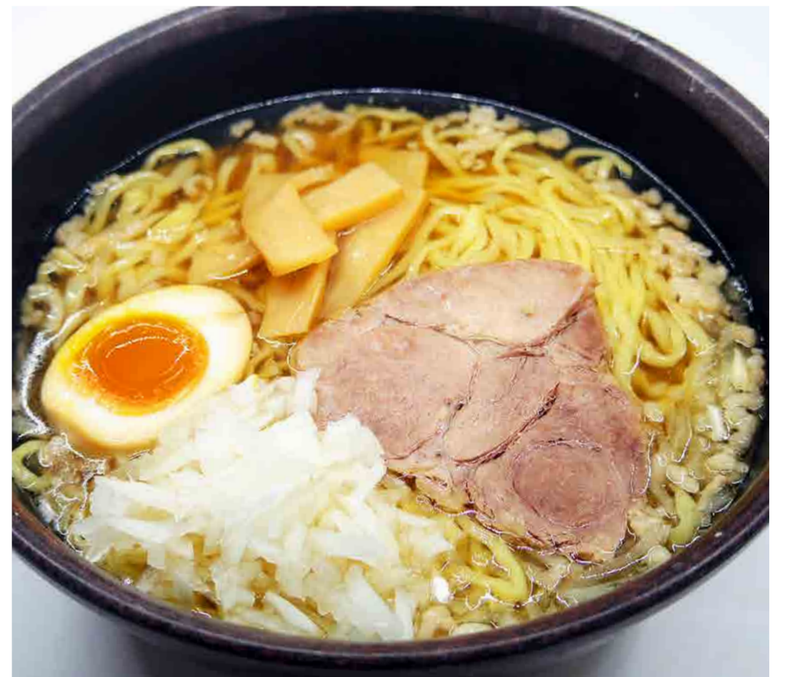
八王子ラーメン ¥600 コレ食べ