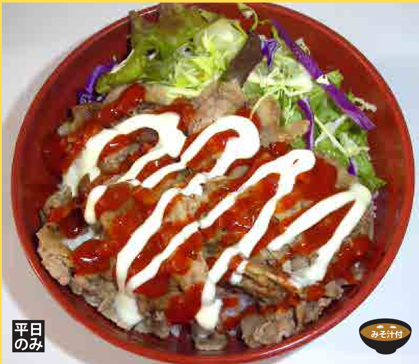
豚肉ケバブ風丼 (2色のソース) ¥580