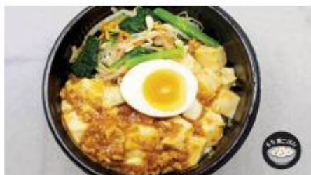
四川風麻婆ビビンバ丼 450円