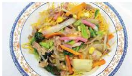
1/3日分の野菜が摂れる 皿うどん 540円