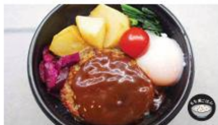
温玉のせろココモコ丼 500円