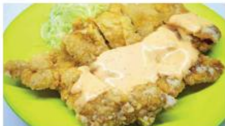
チキン唐揚(明太マヨ) 470円