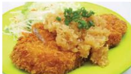
手仕込み豚ロースカツ(おろしポン酢) 650円