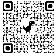
秋募集申込フォーム

秋募集 : https://forms.gle/jrqLZ9rgpWZ3oFRn8