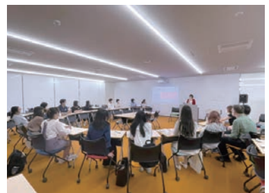
写真:DCT主催イベントの様子

グローバル部会のメンバーとコーディネーターが動画「多様性が尊重されるキャンパスをみんなで作る~ダイバーシティ推進の取り組み~」の制作に協力しました。コーディネーターは動画にも出演しています。