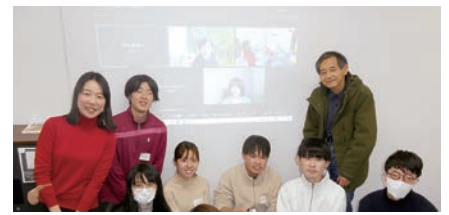
写真:「支援利用学生とSAの交流会」の様子

茗荷谷キャンパス、駿河台キャンパス、小石川キャンパスのバリアフリーマップを作成しました。これで中央大学すべての校地のバリアフリーマップが揃ったこととなります。バリアフリーマップの現地調査には、車いすユーザーの学生も参加し、それぞれの視点から検討を重ね各キャンパスのマップを完成させることができました。