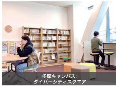
多摩キャンパス: ダイバーシティスクエア

多摩キャンパスダイバーシティセンターの隣にある、ダイバーシティスクエア(Dスクエア)は、学生のための居場所です。主な機能は、安心・安全な居場所の提供、個別相談の対応、書籍・資料の設置(閲覧・貸出)および情報発信の3つです。月曜日～金曜日の授業実施日の10:30～14:30に開室しています。2023年度は、年間約300人の学生・教職員が来室しました。今年度は対面活動の機会が増えたことで、グループ活動の場としても利用されていました。