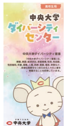
附属校リーフレット