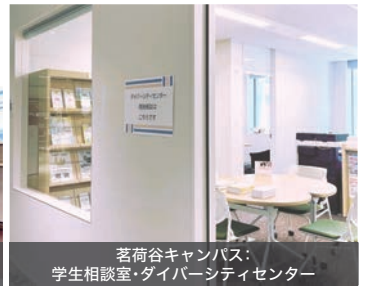
茗荷谷キャンパス: 学生相談室・ダイバーシティセンター

また、2023年4月からは茗荷谷キャンパスにも学生相談室・ダイバーシティセンターが開設されました。こちらは、月曜日～金曜日の授業実施日の10:00～17:00に開室しています。いずれも、休憩や読書、談話や課題等で利用することができ、書籍の貸し出しも行っていきます。