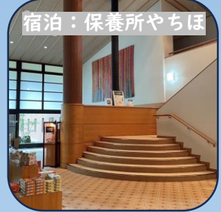
宿泊：保養所やちほ

四季折々の美しい雄大な景色が 満喫できる府中市の保養所 目の前の八千穂レイクも散策可能