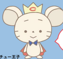
チュー王子

中央大学商学部スポーツビジネスチャレンジ演習は、NPO法人府中アスレティックフットボールクラブ、府中市市民活動センタープラッツと協働し、姉妹都市交流プロジェクトを展開しています。