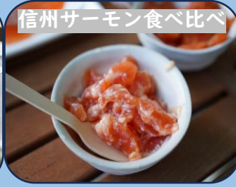
信州サーモン食べ比べ