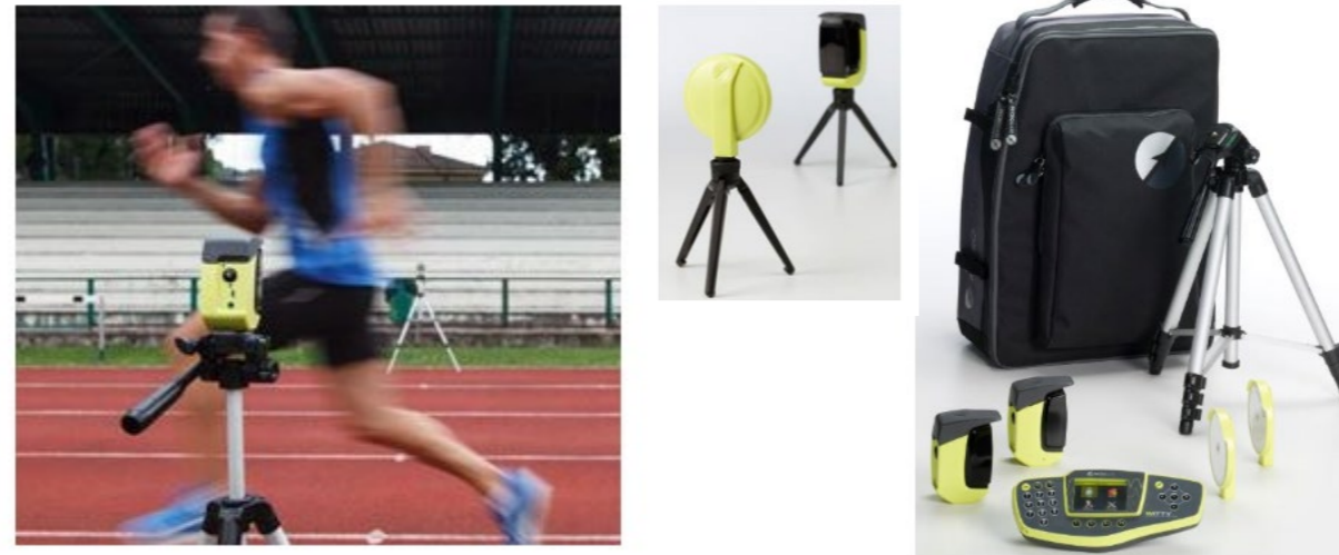
ワイヤレススピード計測システム (WITTY)