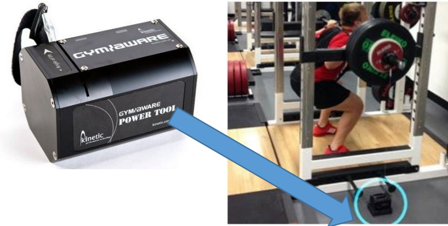
リニアポジショントランスデューサー (Gymaware)