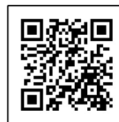
受講料等申込フォームQR

受講料等申込フォーム URL: https://srv4.asp-bridge.net/chuo-u/input/