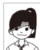
髪やスマートフォンの影がかかっている