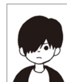
どちらかの目がかくれている