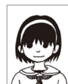
髪が目にかかっている