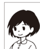
正面を向いていない