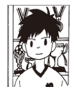
背景があるもの(カーテン、窓、影等が写っている)