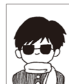
マフラーやサングラスを着用している