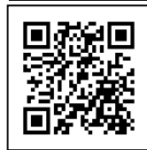
受講料等申込 フォームQR