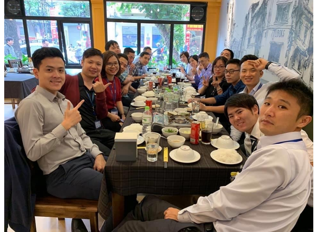
会社の人たちとランチ