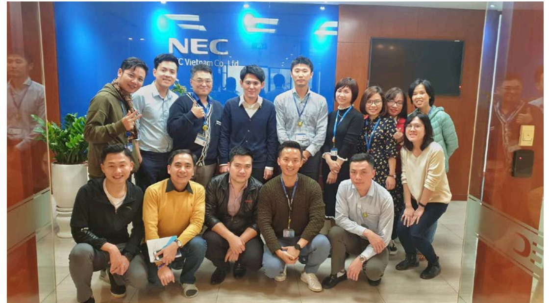
同じ部署の人たちと集合写真