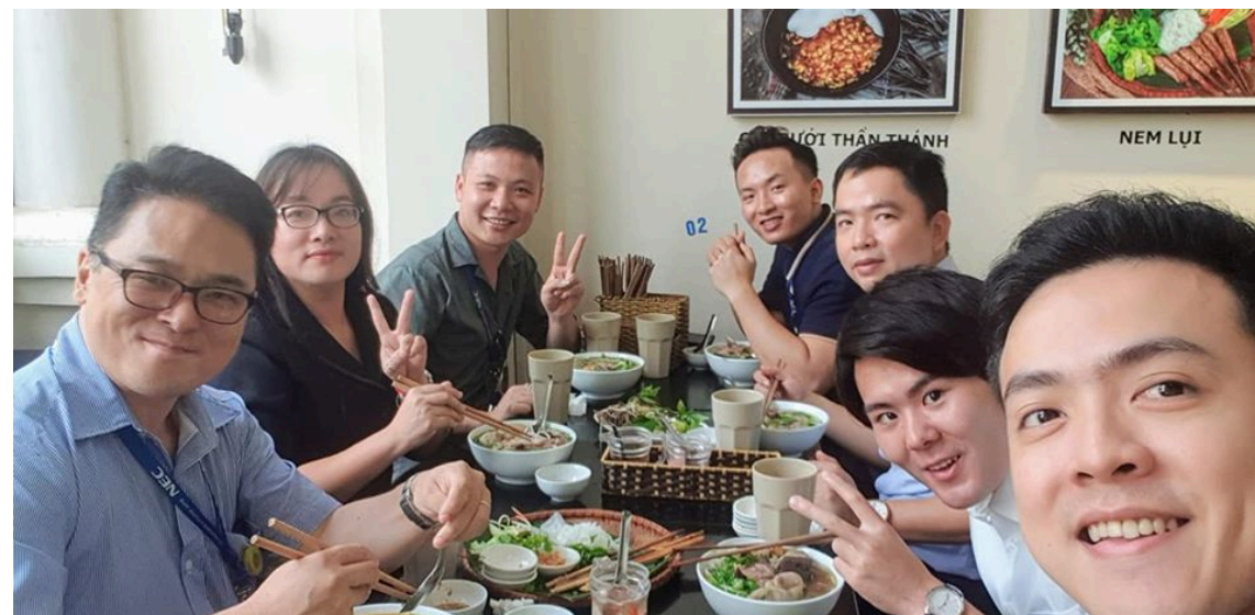
会社の人たちとランチ