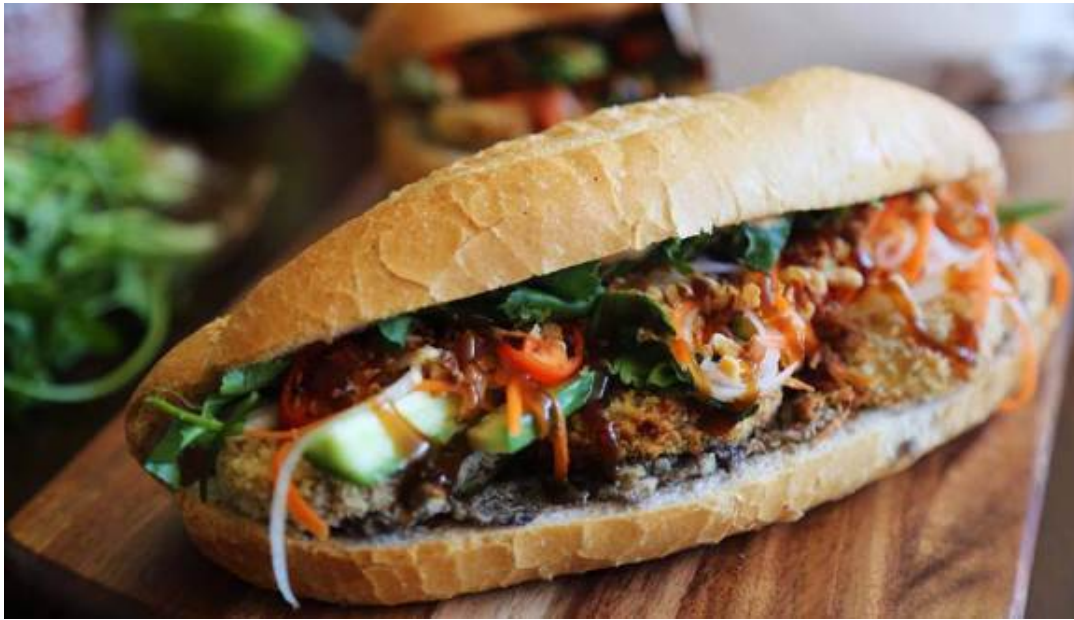
Banh Mi Hoi An(バインミー)