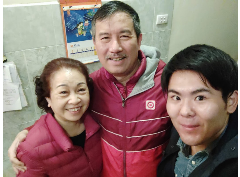
ホストファミリーと