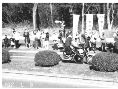
沿道の応援も盛大に！