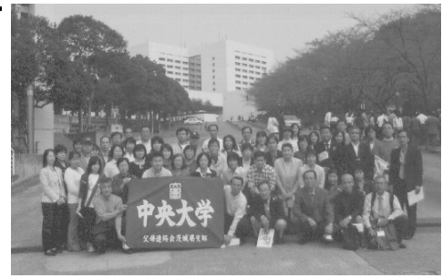
子どもがどのような生活を送っているのか、その一部を垣間見ることができました！