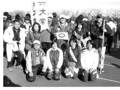
中大選手と記念撮影♪