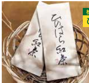
檜原村 ひのはら紅茶