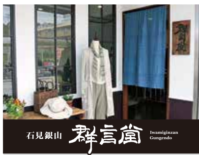
石見銀山 群言堂 Iwamiginzan Gunigondan

※会場は JR 高尾駅北口改札を出て、左側の店舗です。 ※駐車場はありません。公共交通機関をご利用ください。 ※雨天決行(ただし、悪天候などやむを得ない事情により、イベントやメニューの内容が変更、または中止となる場合があります。) ※画像・イラスト・路線図等はイメージです。