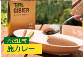
丹波山村 鹿カレー