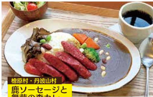
檜原村・丹波山村 鹿ソーセージと 舞茸の森カレー