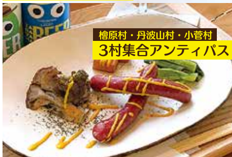
檜原村・丹波山村・小菅村 3村集合アンティパスト