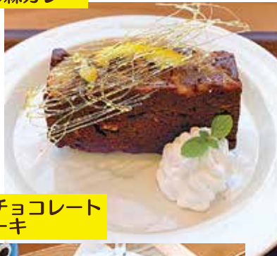
檜原村 ビターチョコレート 柚子ケーキ