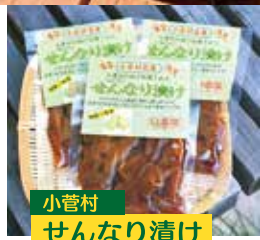
小菅村 せんなり漬け