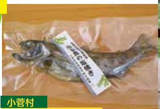
小菅村 山女魚の塩焼き