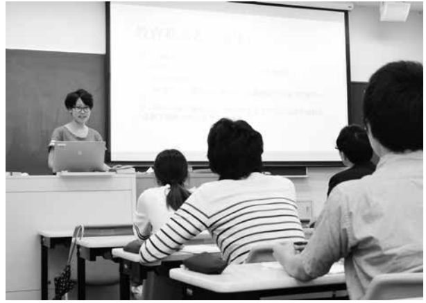
ゼミでは、自分が関心のあるテーマを取り上げるが、“自分の色”をいかに出すかが大切になる。

あります。そうした経験のなかで他者を理解し、やがて同じ現代を生きる人間として、自分たちとの共通点を見つけて、自分自身を見つめる機会を得ることもできます。単に調査対象から成果を得る、という目的のみに心を奪われるのではなく、そうした相互の交流こそ自分にとって大切な経験になるのです。調査内容は最終的にレポートとしてまとめ、もちろん上野村の皆さんにも届ける予定です」