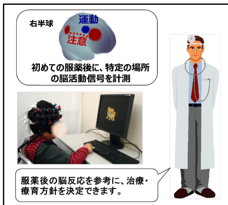
図 2 将来の適用イメージ

今後、日立、自治医科大学、国際医療福祉大学、中央大学は、臨床研究を通じて本技術の開発を進め、神経発達症患者に対して健やかな発達を支援できる社会の実現をめざします。