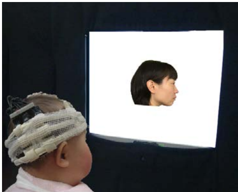
図1 近赤外分光法(NIRS)による脳血流計測の様子。乳児の右後側頭部に近赤外光を照射するためのパッドがついている。

赤ちゃんでは、正面顔は遅くとも生後5か月以降に顔として見ることができる一方、横顔は生後8か月にならないと顔として見るできないことが知られています。これは、2009年に中央大学と生理学研究所のグループによって報告されました。2009年の研究では、生後5か月児と生後8か月児、それぞれ10名を対象に、横顔を見ている時と正面顔を見ている時とで後側頭領域 *1 の脳血流反応に違いがみられるかを、近赤外分光法（Near-Infrared Spectroscopy；NIRS） *2 によって計測することで明らかにしました。しかし、5か月から8か月までの間に、横顔を見る力がどのようなプロセスで発達しているかはまだ検討できていませんでした。