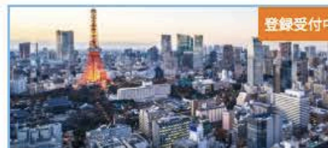
東京ウィンターキャリアフォーラム