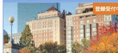
ボストンキャリアフォーラム 2018