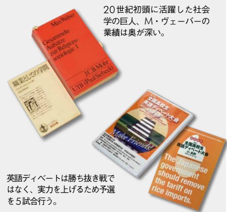
英語ディベートは勝ち抜き戦ではなく、実力を上げるため予選を5試合行う。

大学はゴールではないので、高校時代は、受験技術だけでなく進学後につながる真の「知」の技術を身につけてほしい。私は、全国の高校生たちに英語ディベートを広げる手助けをしています。参加してませんか！