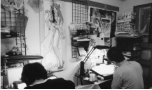
この一室から作品は誕生する