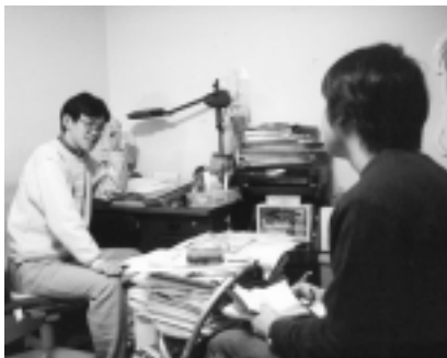
インタビューに答える赤松先輩