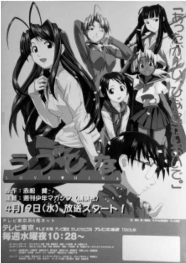
「ラブひな」の放映ポスター

★作品のアイデアはどのようにして考えるのですか。なぜ、ラブコメディーなんです。次回作もラブコ