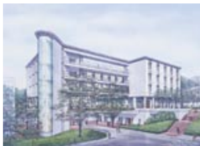
多摩学生生活関連棟