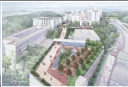
グリーンテラス(仮称)