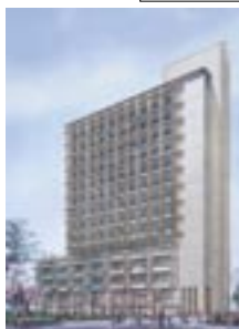
後楽園キャンパス新棟(仮称)