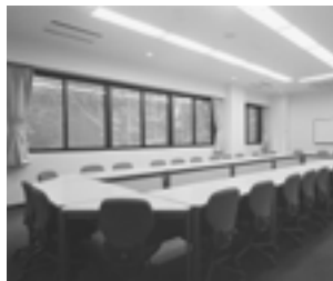
野尻湖セミナーハウスゼミ室A