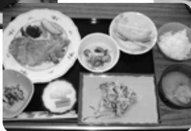
富浦臨海寮夕食一例