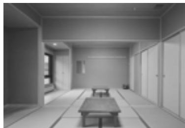
野尻湖 セミナーハウス和室

宿泊は、4泊5日を限度とし、グループ単位(4人以上)で利用できます。セミナーハウス(大学寮)の利用申込は、学生課・理工学部学生生活課にて受付しています。