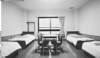
野尻湖 セミナーハウス洋室