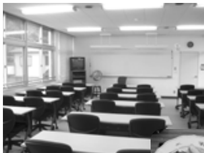
富浦臨海寮 ゼミ室