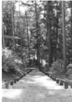
野尻湖 セミナー ハウス 木道