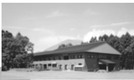
野尻湖 セミナー ハウス 外観