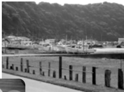
富浦臨海寮 目の前の海辺