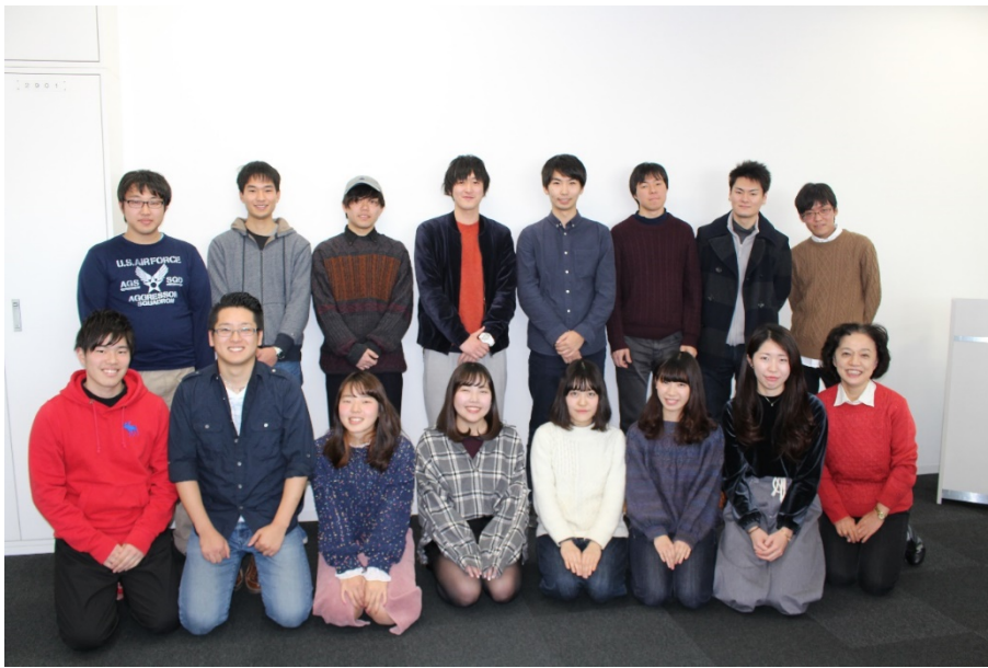
技術士第一次試験合格者数 （在学学生）