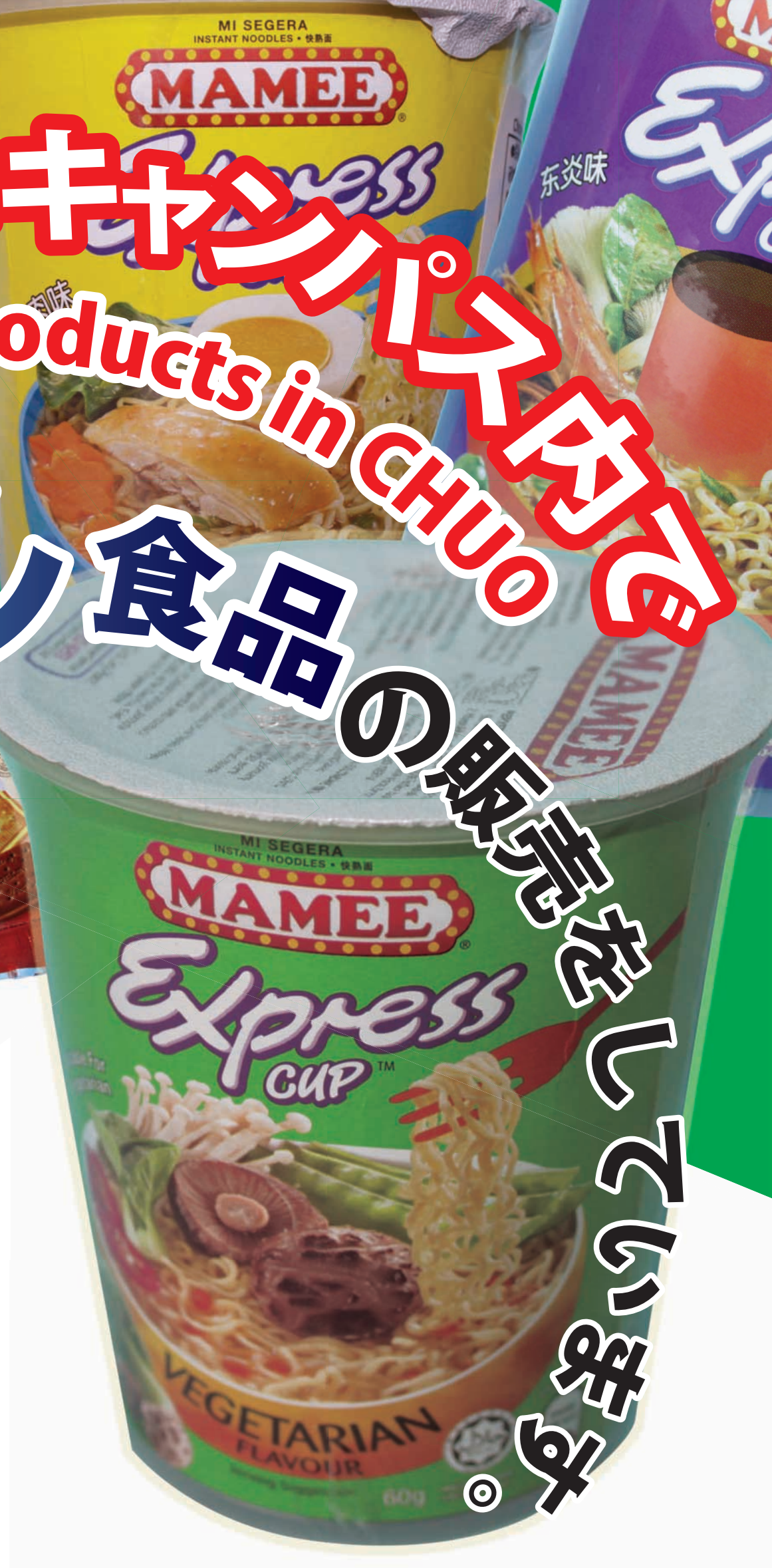
カップラーメン ¥150 (ベジタブル・トムヤム・チキン) クラッカー・ビスケット ¥180 (ビーフコンソメクラッカー・シュガークラッカー・アソートビスケット) 販売：リーフ・カフェ 《Cスクエア》