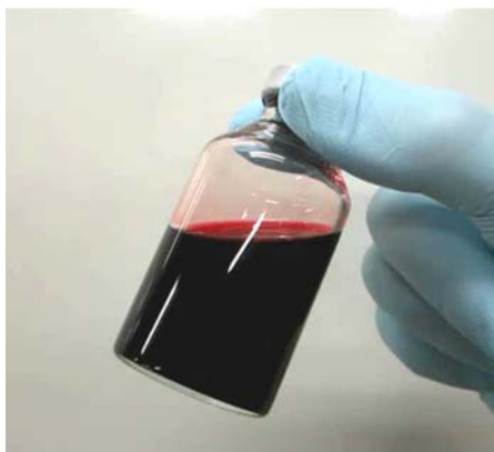
図2. 赤色のヘモアクト™製剤

ブミンで包み込んだクラスター構造が特徴。長い血中体時間、高い安全性が実証された。