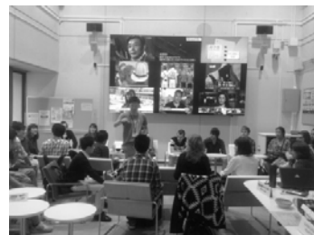
〈Gスクエアでの学生主体の活動〉

事務職員の外国語運用能力向上のため、ビジネス英語通信講座、外国人講師による英文メール・書類作成の研修を実施し、合計69名が参加した。平成25年11月に英国大学訪問研修へ職員1名を派遣した。その後、各大学と教職員交流について折衝をしている。