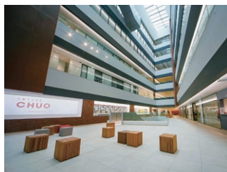
1F エントランス吹抜空間