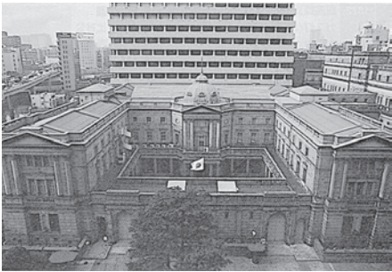
(出典：詳説日本史図録編集委員会編 『詳説日本史図録』第10版、 山川出版社、2023年、272ページ。)