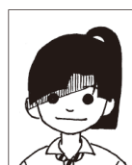
髪やスマートフォンの影がかかっている