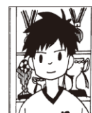
背景があるもの(カーテン、窓、影等が写っている。)