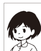
正面を向いていない