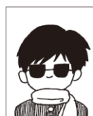
マフラーやサングラスを着用している