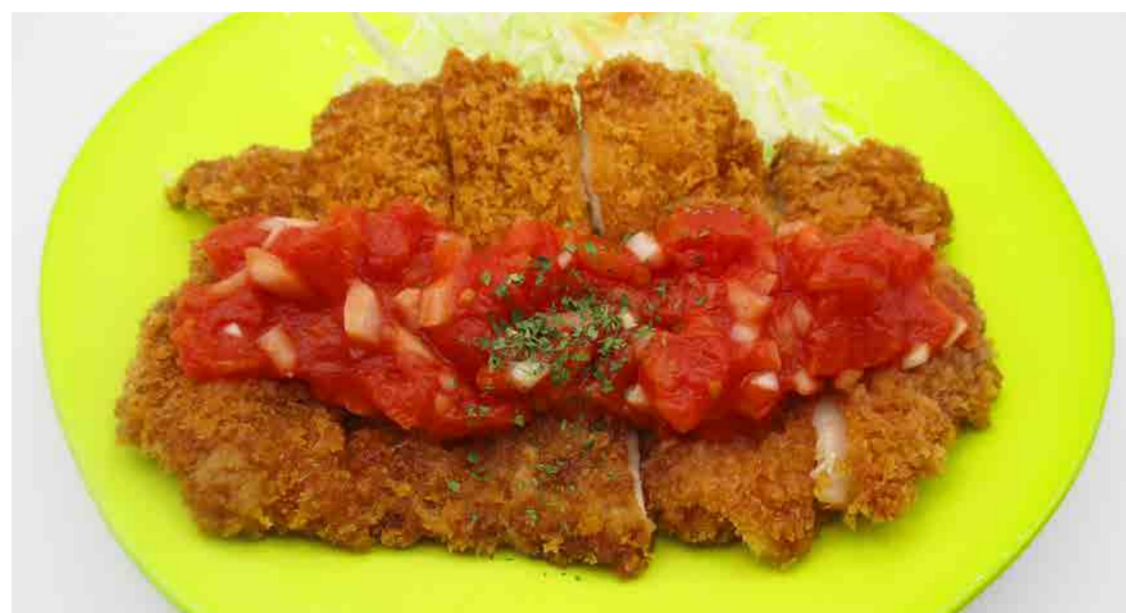
チキンカツ (トマトレモンソース) 450円