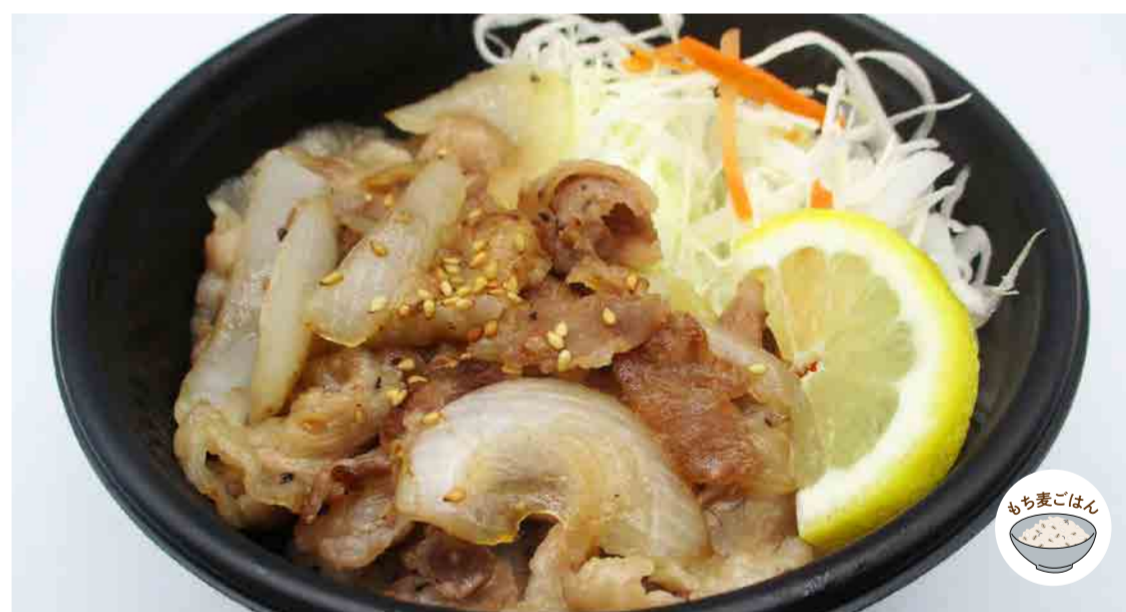
ねぎ塩レモンの豚カルビ焼肉丼 480円