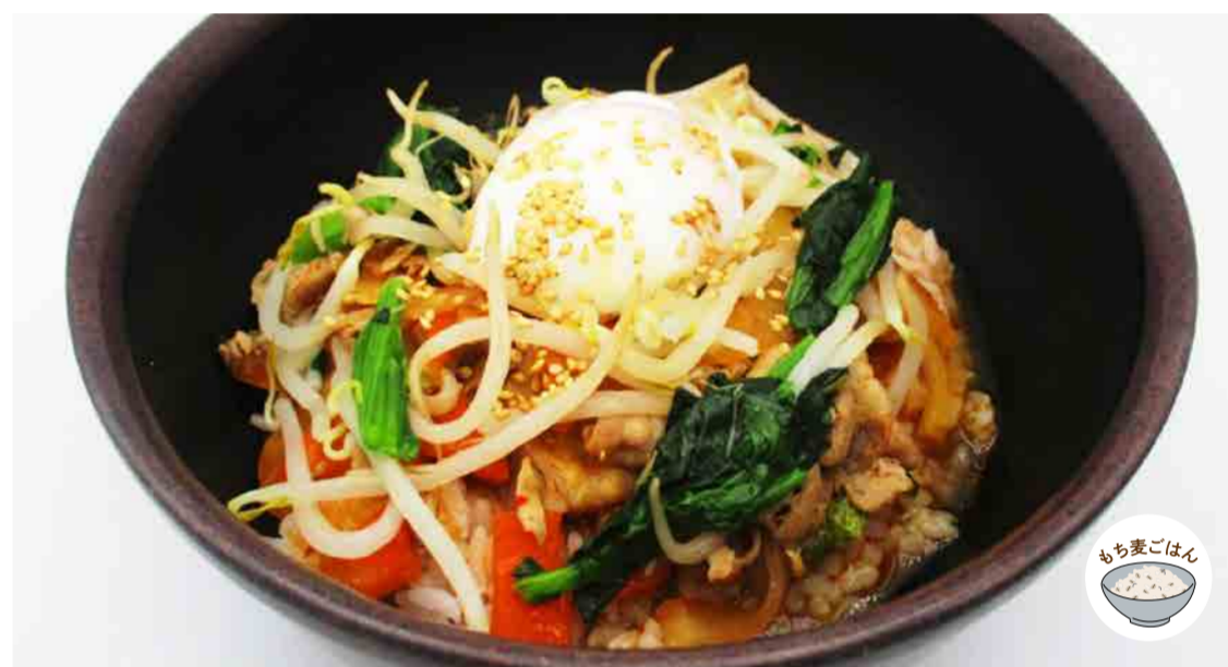
具だくさんの豚カルビクッパ (温玉のせ) 620円