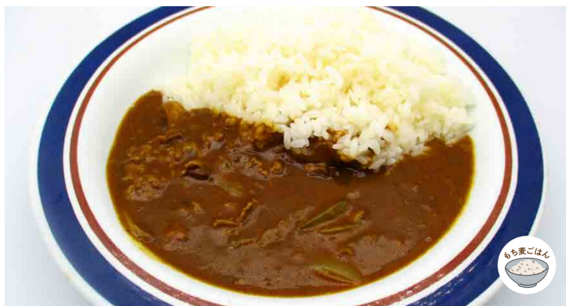
大阪あまからビーフカレー 640円