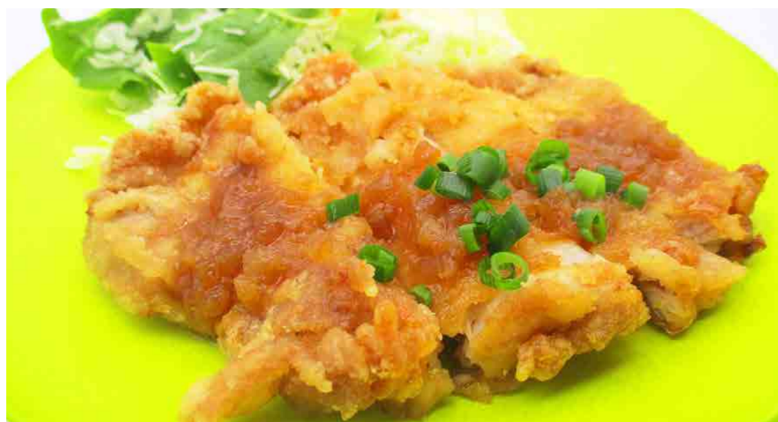
チキン唐揚 (和風オニオン) 470円