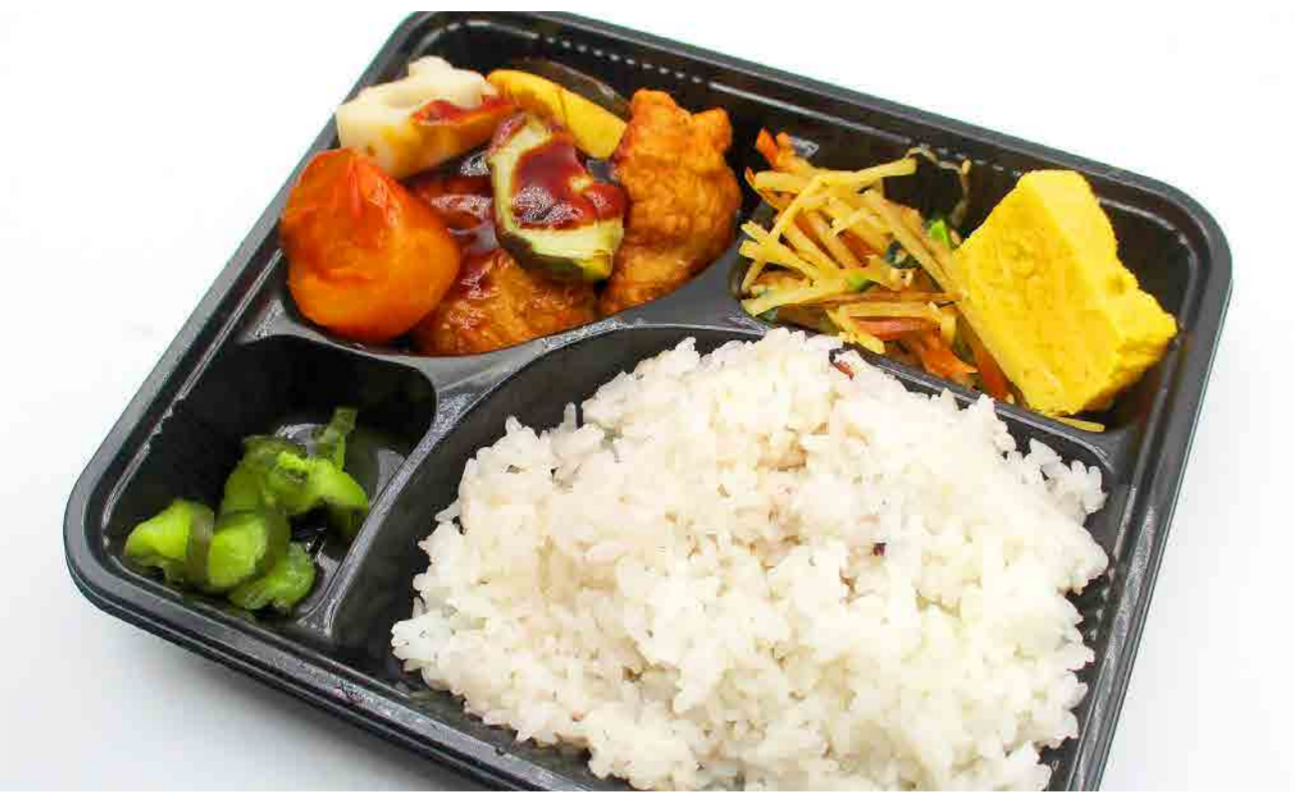
デリ弁当(鶏黒酢あん) ¥430