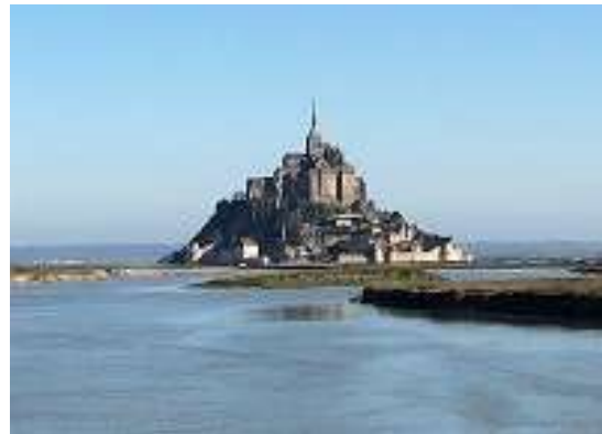
モン・サン・ミシェル