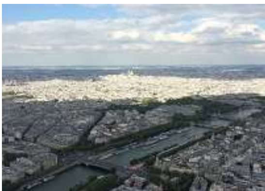
パリの町とセーヌ川

でも、外国語を学ぶことの本当の意義は、出会いやビジネスチャンスにあるわけではありません。外国語を学ぶことによって、自分の母語や文化のフィルターを通してしか見ていなかった世界を、別の視点から見るできるようになります。そうすると、同じ物事を見ていても見え方が違ってきますし、母語を通じた認識の枠組みが唯一の認識の枠組みではないことにも気づきます。「多様性（ダイバーシティ）」はグローバル化された世界で生きていくためのキーワードになっていますが、それは世界が多様であるというよりむしろ世界の見方、見え方が多様であることを表します。「第二」外国語と言わず、「第三」でも「第四」でも、多様な言語に触れて、多様な世界の見方を身につけましょう。