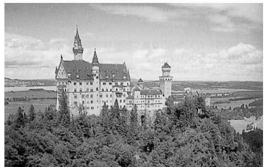
ノイシュヴァンシュタイン

ドイツ語のみが単独で公用語の国は、ドイツ連邦共和国、オーストリア共和国、リヒテンシュタイン公国の3カ国です。次に他の言語と併用ながら、スイス、ベルギー、ルクセンブルクが公用語としてドイツ語を使用しています。そのほか北イタリアの南チロル地方、フランスのアルザス地方、デンマークの南部、ポーランド、チェコ、ハンガリーなど東ヨーロッパの一帯でもドイツ語が使われています。これらの地域では英語よりもドイツ語のほうが通じることも珍しくありません。ドイツ語を使用する人は、世界でおよそ1億1千万人、世界第9位、ヨーロッパ地域ではロシア語についで第2位なのです。