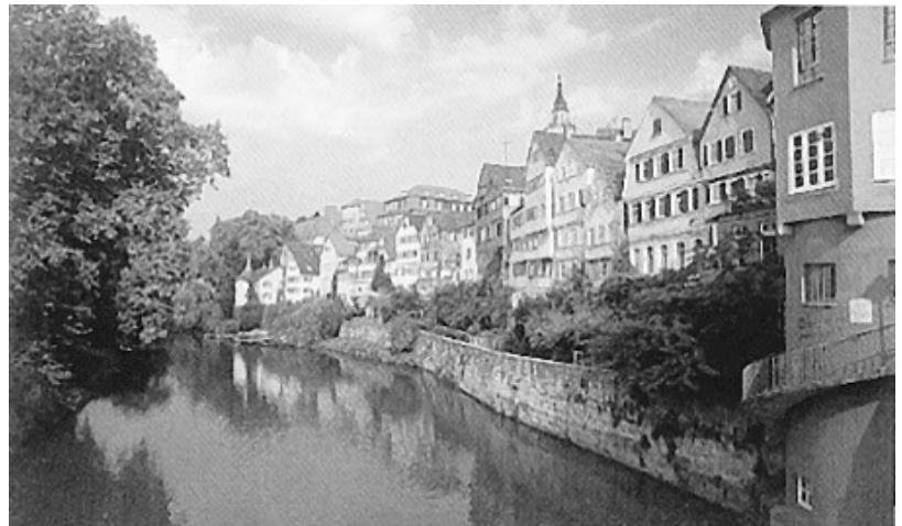
テュービンゲンの家並み

さらに半期ないし1年の交換留学制度もあります。独検3級合格、2級受験済みが出願の条件です。（詳しくは国際センターへ。）ドイツ語圏の大学は理工系の研究のレベルも高く、また比較的リーズナブルに留学することができます。ぜひ留学にも挑戦してみましょう。