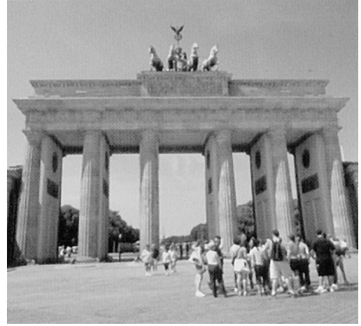
ブランデンブルク門

大学に入って学び始める科目の多くは、既に何らかの形で高校までに学んでいるものです。しかし、大部分の学生にとって初めて接する科目があります。それは何といても英語以外の外国語です。理工学部には第2外国語としてドイツ語・フランス語・中国語が開講されています。これまでに学んだことのない科目に挑戦することは楽しいことであり、いやがうえにも知的好奇心が喚起されるものです。大学生になった今、未知なる世界の門をたたき、ドイツ語という新たな言葉を学んで、大いなる知を我が物とする出会いと発見の旅に出かけてみようではありませんか。