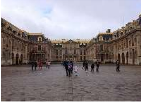
ヴェルサイユ宮殿

世界遺産があり、これが世界の観光客をひきつける要因になっています。みなさんのなかにも、モン・サン・ミシェル、シャルトル大聖堂、ヴェルサイユ宮殿などを知っていて、フランスに旅行したらぜひ訪れてみたいと思っている人がいるのではないのでしょうか。また、スペインとの国境にはピレネー山脈、スイスとイタリアとの国境にはアルプス山脈があり、そこからいくつもの河川が流れ出て、内陸部に広がる平野を潤し、北西は大西洋、南は地中海に注ぎます。そうした多様な自然の地形が、フランスのそれぞれの地方に特有の風景を与えています。そこを自転車で走破するツール・ド・フランスは、サッカーとならんでフランスでとても人気のある競技です。