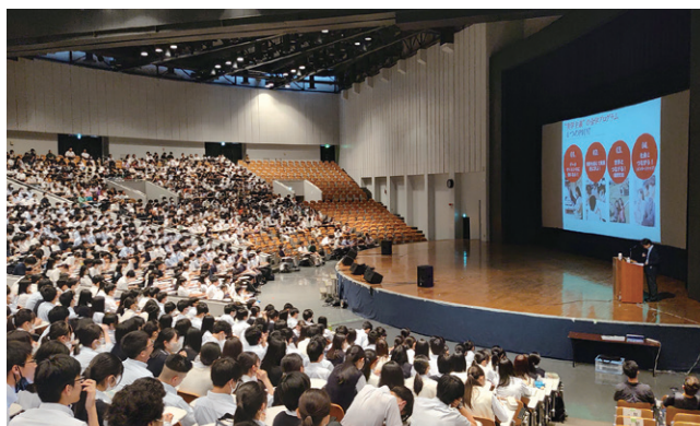
高校1年生「中央大学を知ろう」(多摩キャンパス)