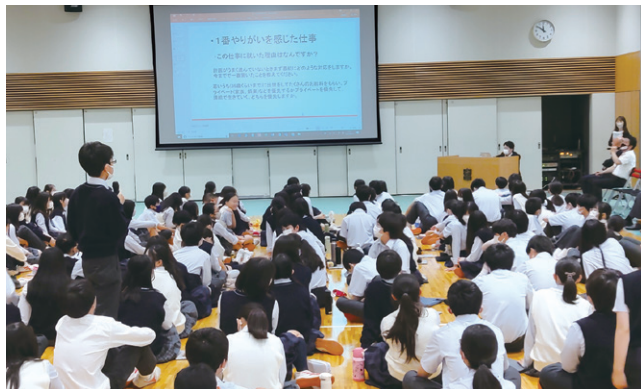
中学2年生「働かってどんなこと？」(中央大学附属横浜中学校)