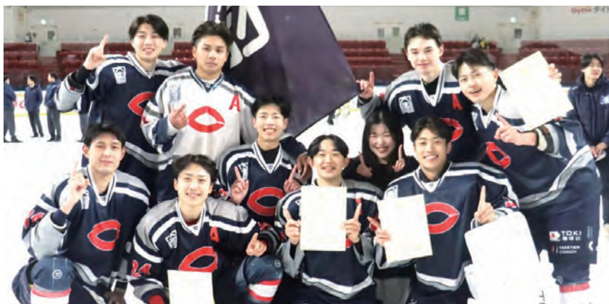
4年生だけで記念の一枚

みんなのおかげです。みんなと濃密な時間を過ごすことができて本当によかった。同期がみんなでもよかった。これからもよろしく。