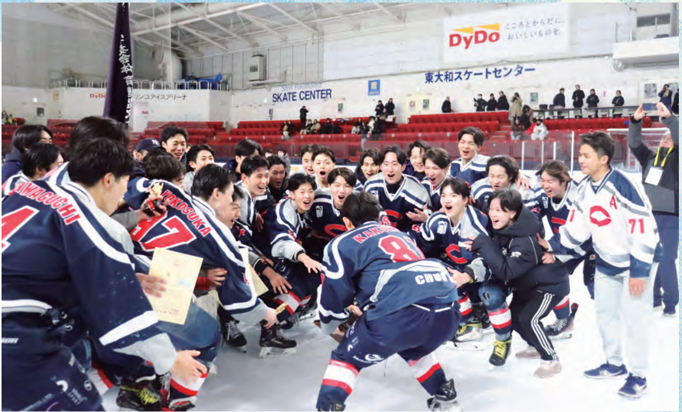
やったぜ！ みんないい顔してる！