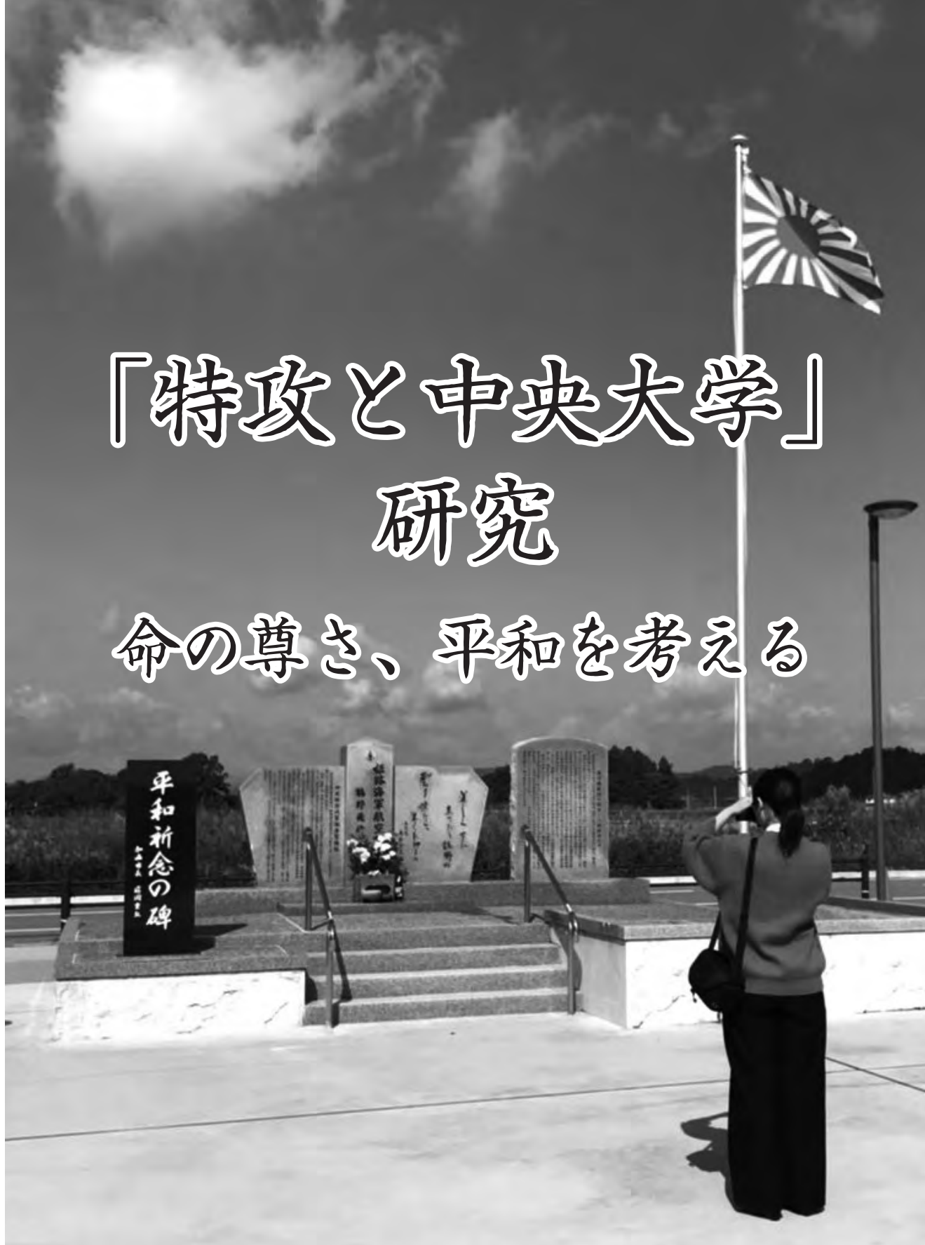
鵜野飛行場跡の平和祈念の碑▲