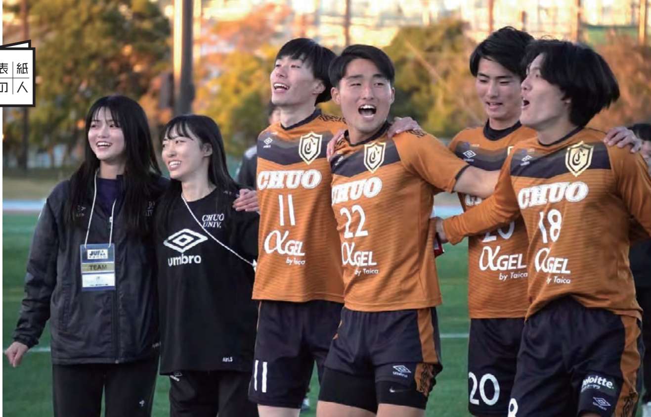
関東1部リーグ残留に部員の笑顔が弾けた=2023年12月2日▲

るリプライが多く寄せられた。重い病気を患っている高齢の男性からは「水戸のゲームを見るのが生きがい」という言葉を直接聞いた。